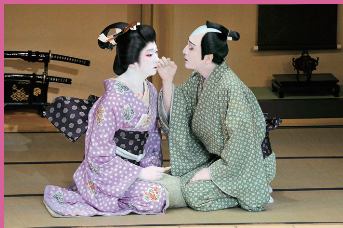
舞台写真